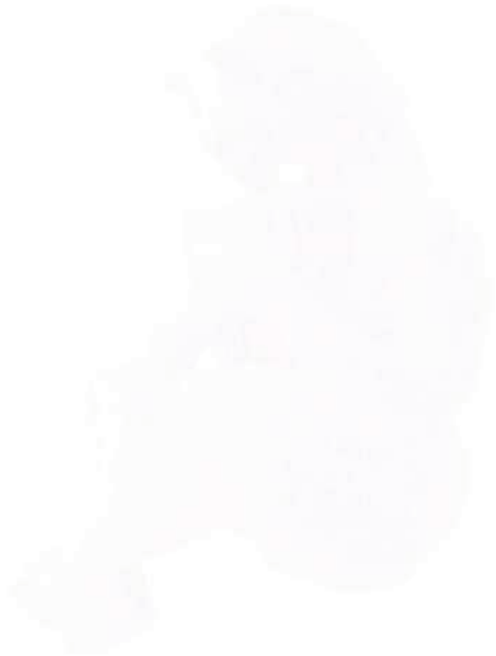
Naslovnica skulptura Pan (2007.) djelo akademskog kipara Vitolda Košira Frontpage skulpture Pan (2007) by Vitold Košir